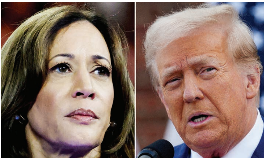
ترامب وهاريس

وتقام الانتخابات الثلاثاء وهو يوم عمل عادي