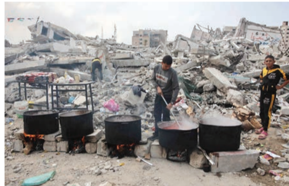
فلسطيني يقوم بإعداد وجبات الطعام لتوزيعها على التاردين

قال مدير مكتب برنامج الغذاء العالمي في برلين مارتن فريك لوسائل إعلام ألمانية: إن البرنامج لا يمكن أن يكون بديلاً لوكالة الأمم المتحدة لإغاثة وتشغيل اللاجئين الفلسطينيين في الشرق الأدنى «الأونروا» في قطاع غزة. وقال فريك: «لا يمكننا أن نقوم بالمهام المهمة التي تقوم بها الأونروا في غزة، مثل إدارة ملاجئ الطوارئ والمدارس والمراكز الصحية». وكان البرلمان الإسرائيلي وافق قبل أيام على مشروع قانونين مثيرين للجدل لتقييد عمليات الوكالة في قطاع غزة. وقال فريك: إن الأونروا هي العمود الفقري للمساعدات الإنسانية في قطاع غزة، وتضمن «التغذية والحماية والرعاية الطبية للسكان الذين يعانون من أحوال غير إنسانية». وأضاف فريك أن الأزمة الإنسانية في قطاع غزة لا يمكن تصورها وتتطلب استجابة شاملة تقوم الأونروا بالدور المركزي فيها، مؤكداً أن «خطر الأونروا سيحرم أولئك الذين يكافحون للبقاء من آخر مواردهم». وأمس الأول، دعا رؤساء 15 منظمة إغاثية تابعة للأمم المتحدة ومجموعات خاصة في بيان مشترك إلى الإنهاء الفوري للقتال في قطاع غزة، محذرين من أن خطر الموت يتربص بجميع سكان شمال القطاع، مؤكداً أن الوضع في شمال القطاع الساحلي، بات مأساوياً بشكل خاص. وجاء في البيان الذي نشرته اللجنة الدائمة المشتركة بين وكالات الأمم المتحدة: إن جميع السكان الفلسطينيين في شمال غزة مهددون بخطر الموت الوشيك بسبب المرض والجوع والعنف. وشملت قائمة الموقعين على البيان رؤساء مكتب الأمم المتحدة لتنسيق الشؤون الإنسانية، والمفوضية السامية للأمم المتحدة لشؤون اللاجئين، ومنظمة الأمم المتحدة للطفولة «يونيسف»، ومنظمة الصحة العالمية، وبرنامج الأغذية العالمي، ومنظمة أوكسفام.