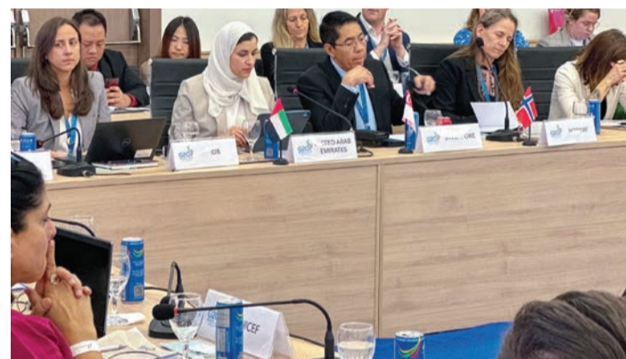
سارة الأميري ترأس وفد الدولة خلال الاجتماع

التموية كافة في مختلف المجالات، وذلك بناءً على توجيهات ودعم القيادة الرشيدة التي جعلت منه أولوية وطنية راسخة، وهو ما يترجمه حجم الاستثمار الكبير في قطاع التعليم في الدولة؛ لذلك نحرص على مشاركة رؤانا التربوية مع العالم، والاستفادة كذلك من تجارب العالم التربوية، بما يعزز من مسارات التطوير في منظومتنا التعليمية الوطنية، ويرتقي بها نحو مزيد من آفاق الريادة والتميز».