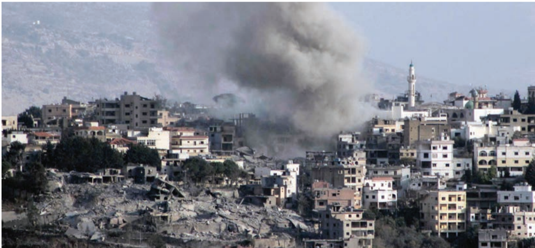
دخان يتصاعد من موقع غارة جوية اسرائيلية استهدفت قرية الخيام بجنوب لبنان