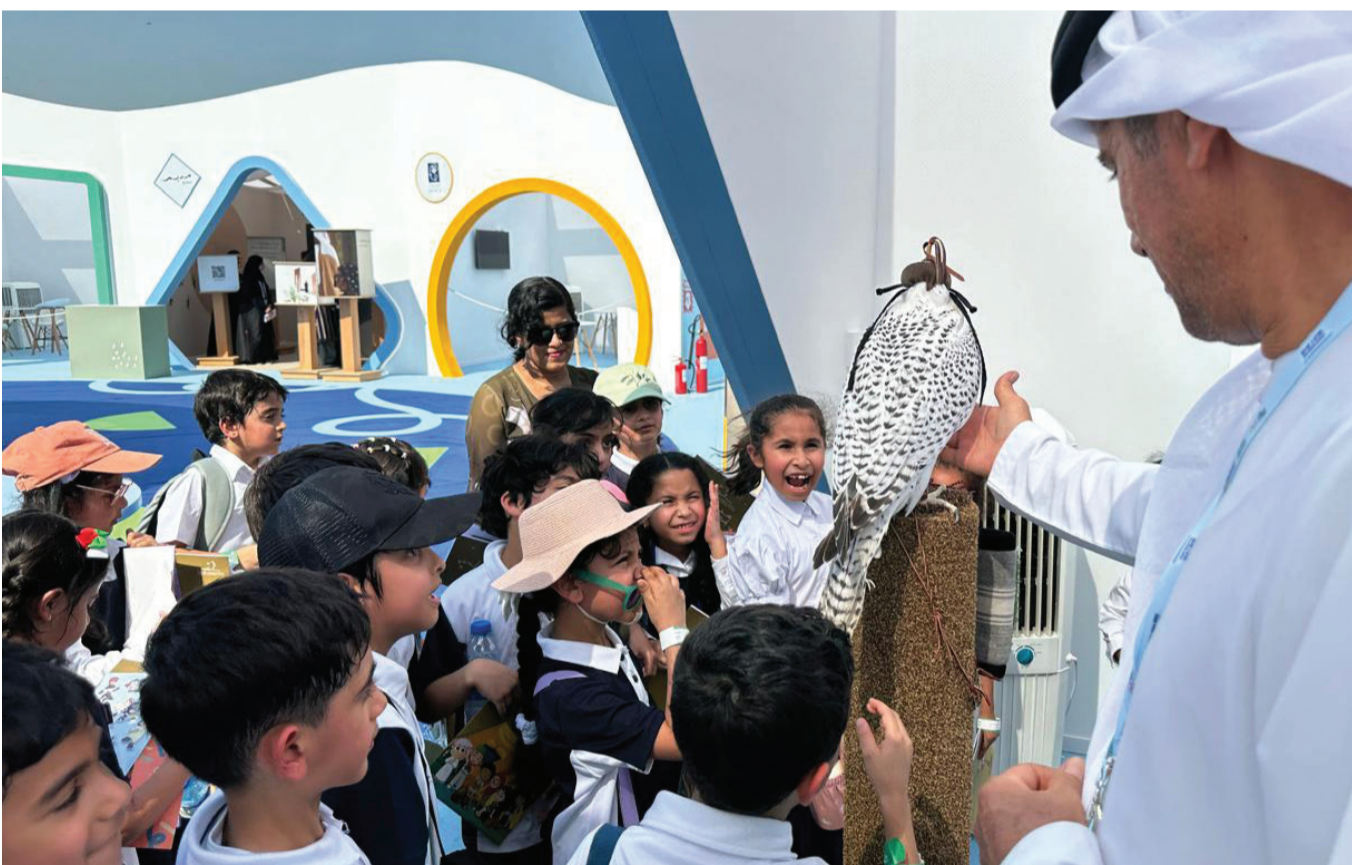
تفاعل الأطفال مع عروض الصقور

وعرّف نادي صقاري الإمارات بأهدافه في صون التراث الثقافي والحفاظ على التقاليد الأصيلة، حيث حرص على تعزيز الوعي بأهمية الحفاظ على التراث وصور الصقارة، وقدم للزوار نشرات وكتيّبات تعريفية وشاشات عرض سلّطت الضوء على مشاريع النادي ومبادراته.