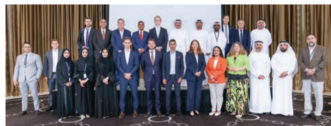
مشاركون في الاجتماع

وتم خلال الاجتماع الذي استضافته مجموعة موانئ أبوظبي، وترأسته المهندسة حصة آل مالك، مستشارة الوزير لشؤون النقل البحري في وزارة الطاقة والبنية التحتية، بحضور ممثلين عن الموانئ في الدولة وشركاء القطاع البحري، تسليط الضوء على القضايا المحورية التي تواجه قطاع الموانئ.