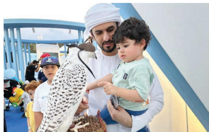
أجواء تراثية خلال المعرض

بأهداف النادي في صون الصقارة والتراث الثقافي والحفاظ على التقاليد الأصيلة، حيث يُقدّم برامج حيّة حول ممارسة رياضة الصيد بالصقور، ويُتيح الفرصة لكل من يرغب بالتقاط الصور التذكارية داخل منصّاته مع الصقارين بصحبة الصقور والسلوقي. ويسعى نادي صقاري الإمارات منذ تأسيسه في عام 2001 من خلال مشاريعه، للحفاظ على الصيد بالصقور كتراث