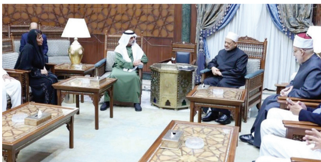
نهيان بن مبارك في حديث مع شيخ الأزهر بحضور مريم الكعبي