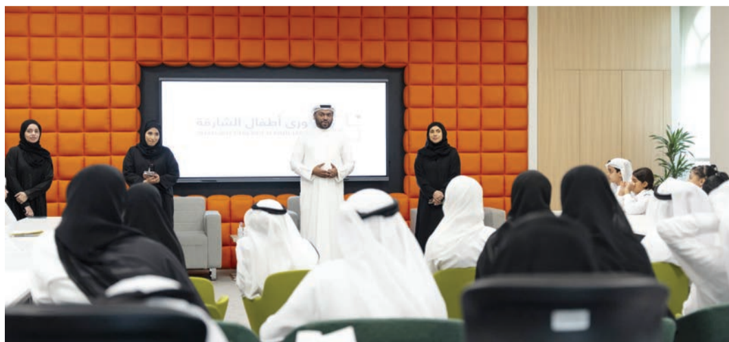
مشاركون في الجلسة النقاشية

رؤية مبكرة منذ مراحل التأسيس الأولى آمنت بأن الاعتناء بالطفولة المبكرة هو اعتناء واهتمام ببناء أجيال سليمة، قادرة على التعامل مع التحديات لبناء مستقبل زاهر جميل، يليق بما يجب أن تكون عليه إمارات المحبة والعطاء، وتحقيق الريادة المنشودة، وهو ما تحقق بالفعل، ونحن نشهد ونعيش المبادرات المتلاحقة ليكون المواطن الرقم واحد في معادلة التقدم والرفق.