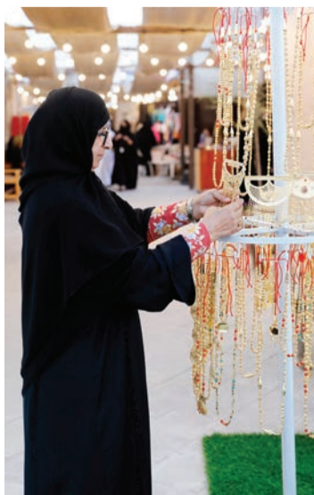
الحرف اليدوية تاريخ يتوارثه الأجيال

يعمل المهرجان على تعزيز ثقافة صون التراث الإماراتي والاعتراف به، من خلال أنشطة وفعاليات تحت النشء على التمسك بالتراث، وتربط الجيل الحالي بتفاصيل الحياة الإماراتية القديمة التي عاشها الأجداد، وللتأكيد على غنى التراث الإماراتي. وتترزين ساحات القرية باستعراضات الفنون الشعبية الإماراتية بإداء موسيقي ملفت يعكس المخزون التراثي، والموروث الوطني الذي يمثل عبق المعاني بروح الألفة والمودة والمحبة التي قضاها وعاشها الأجداد، ليبقى راسخا في النفوس، ورمزا ملهما لتعزيز الهوية والانتماء للوطن.