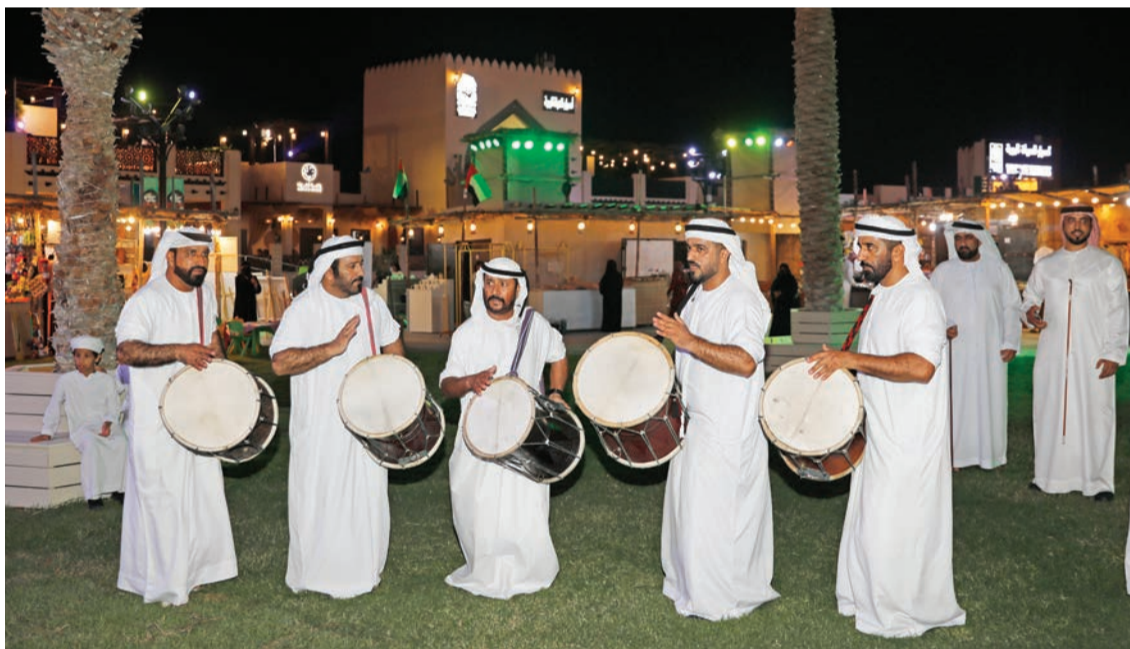
عروض شعبية تنفخ أجواء من بهجة ضمن القرية التراثية