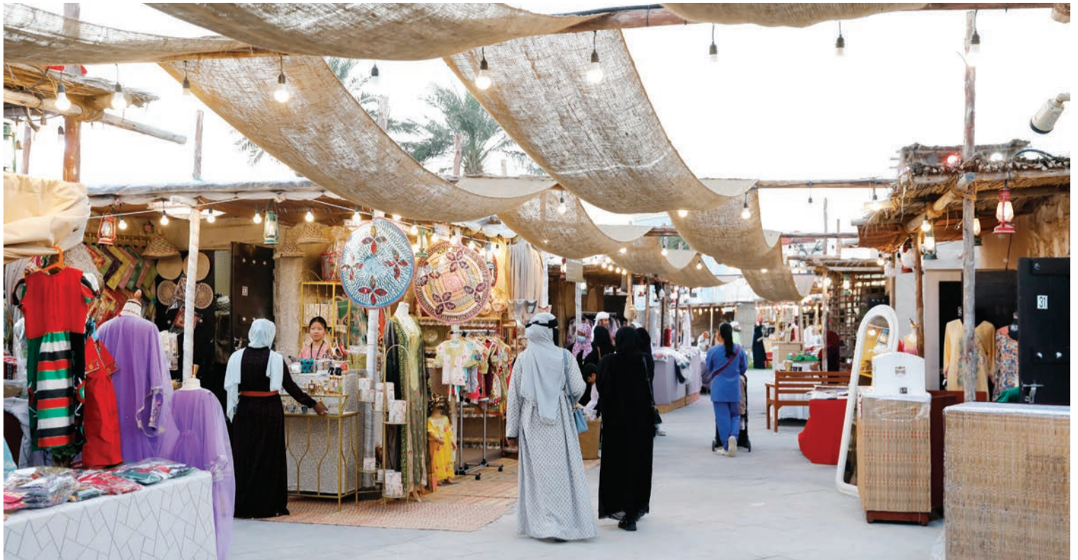
زوار المهرجان يتجولون في أروقته

نحتاج جميعاً إلى ضمان أن الأطفال، بغض النظر عن قدراتهم أو أعمارهم أو أحلامهم، يمكنهم الوصول إلى إمكاناتهم الكاملة. يمكننا تعزيز التعليم الشامل، ويمكن أن يبدأ ذلك منكم كرواد أعمال أو مقدمي رعاية أو حتى معلمين. يمكن أن يكون توفير وتطوير موارد مختلفة للمدارس والمؤسسات التعليمية له تأثير كبير على الأطفال لتمكينهم من تحقيق إمكاناتهم الكاملة.