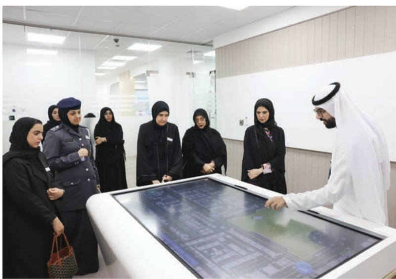
خلال الزيارة

زايد للعلوم الشرطية والأمنية اهتمام القيادة الشرطية بفتح آفاق جديدة لشراكة استراتيجية تعزز من تبادل المعرفة وترسيخ مفاهيم الهوية الوطنية، بما يسهم في بناء مستقبل مشرق لأجيالنا القادمة، في إطار السعي المستمر لبناء جسور التواصل بين شرطة أبوظبي والمؤسسات المجتمعية ودعم متطلبات الأمن والأمان في المجتمع، وتنفيذ مشاريع مستقبلية مشتركة تحقق أهداف التنمية المستدامة في دولة الإمارات وتمكين الشباب من تحقيق تطلعاتهم في خدمة الوطن.