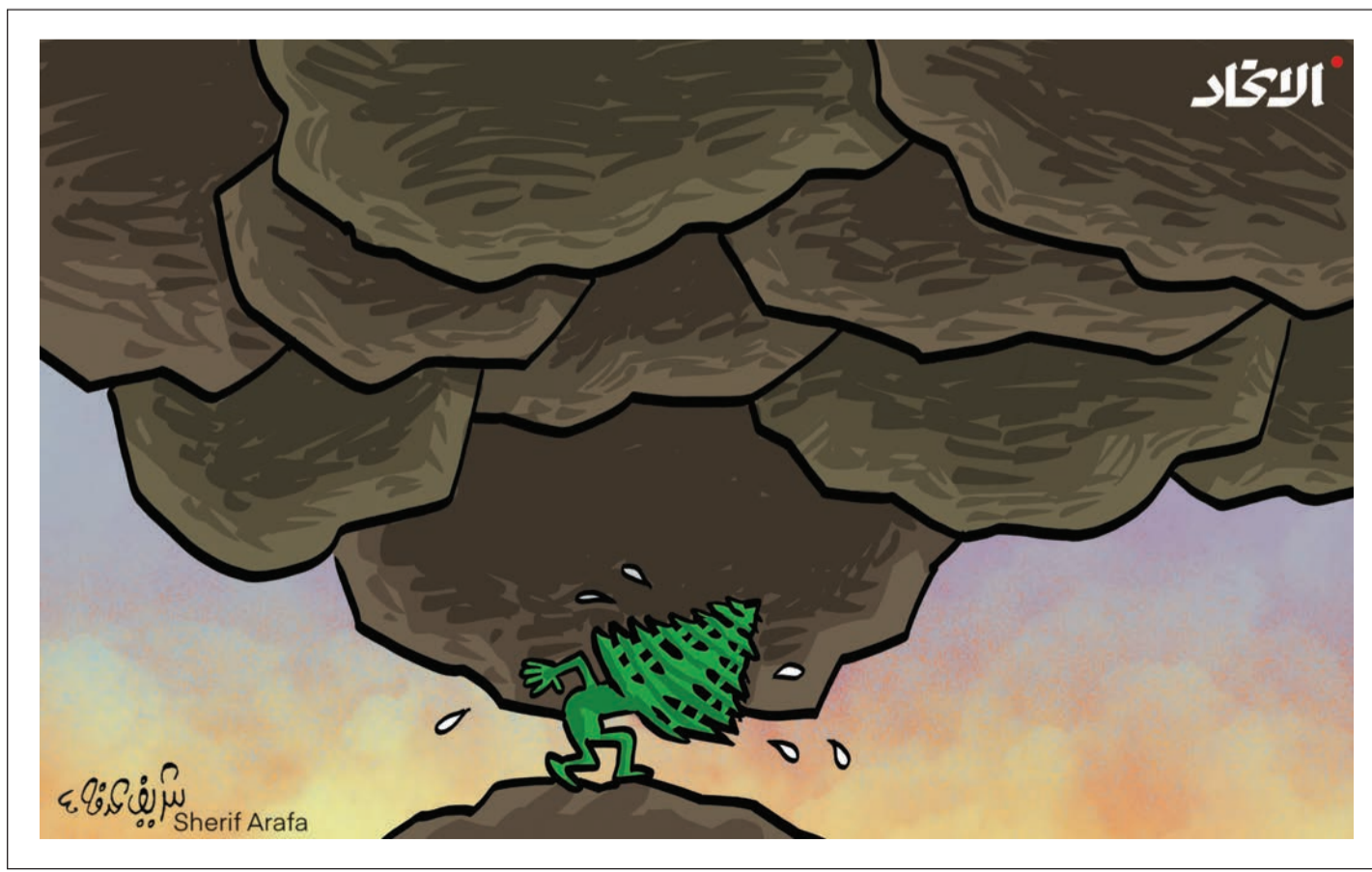
شريف أرافة Sherif Arafa