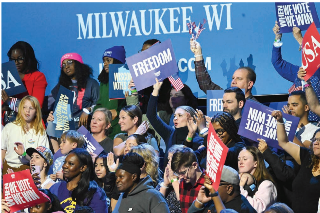
مؤيدون شباب تجمّع انتخابي للمرشحة للرئاسة الديمقراطية كامالا هاريس