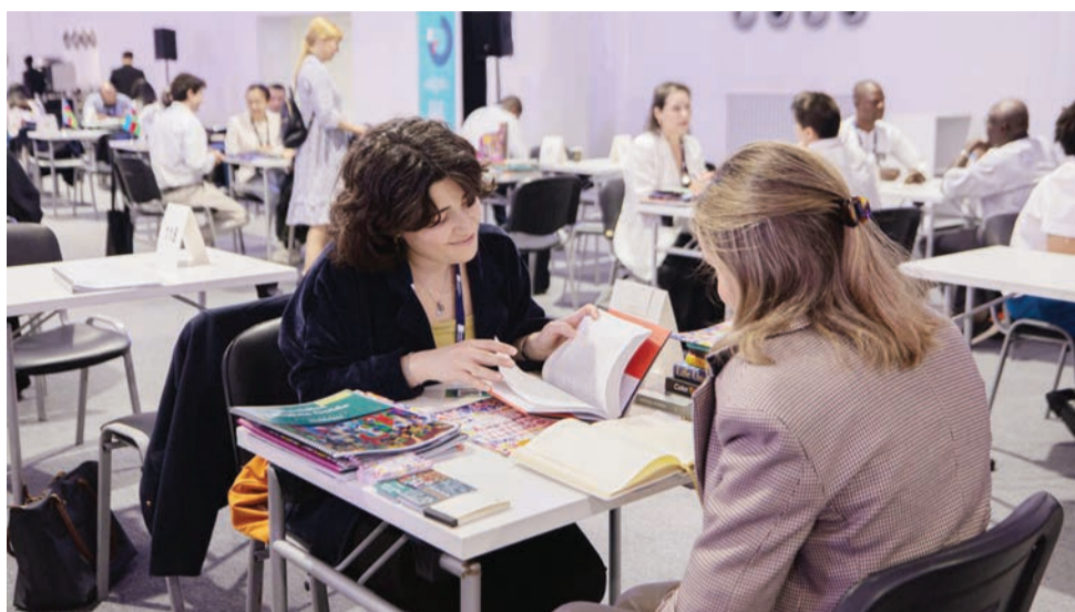
من مؤتمر الناشرين (أرشيفية)

بحضور الشارقة دور بنت سلطان القاسمي، رئيسة مجلس إدارة هيئة الشارقة للكتاب، تنطلق فعاليات الدورة الـ14 من «مؤتمر الناشرين»، اليوم، في مركز إكسبو الشارقة، بمشاركة 1065 ناشراً وخبيراً في صناعة النشر العالمية ونخبة من الوكلاء الأدبيين وقادة فكر من 108 دول، إلى جانب 74 متحدثاً دولياً، لتبادل الخبرات والأفكار حول ديناميكيات قطاع النشر وسبل تعزيز التعاون والشراكات وعقد الصفقات بين المشاركين. وفي خطوة لتعزيز الجانب التفاعلي للمؤتمر، يقدم نخبة من الخبراء 30 ورشة عمل تغطي عدداً من الموضوعات، منها أحدث توجهات وابتكارات قطاع النشر، والتحديات التي تواجهه وسبل التغلب عليها وتحولها إلى فرص، وتسويق المحتوى الصوتي، واستخدام الذكاء الاصطناعي في النشر، واستراتيجيات التوزيع الرقمي، وذلك قبيل انطلاق فعاليات الدورة الـ43 من «معرض الشارقة الدولي للكتاب».