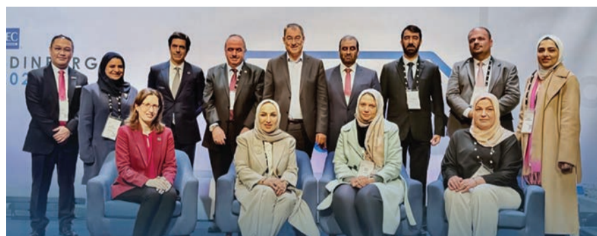
مجلس إدارة اللجنة الكهروتقنية الدولية (وام)

الإنتاج يؤكد مكانة الدولة في منظومة البنية التحتية للجودة سلطان الجابر