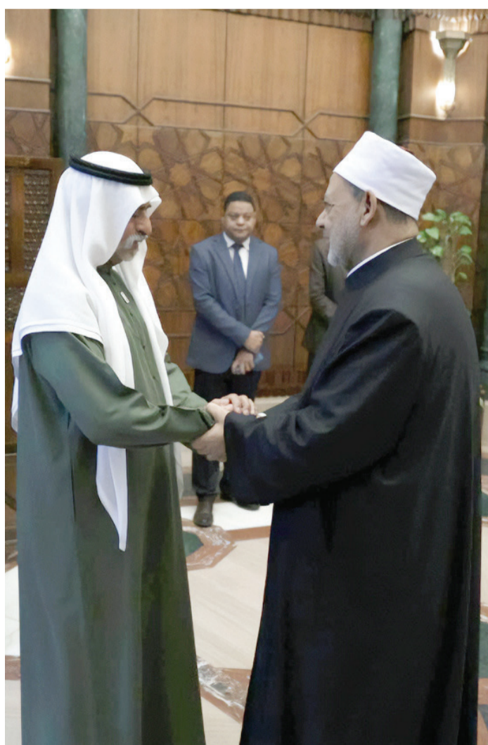
نهيان بن مبارك يصفاح شيخ الأزهر